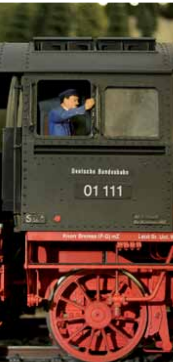
Unter Dampf oder elektrisch – Modellbahnen in Stuttgart, Winnenden oder Kirchheim/Teck.