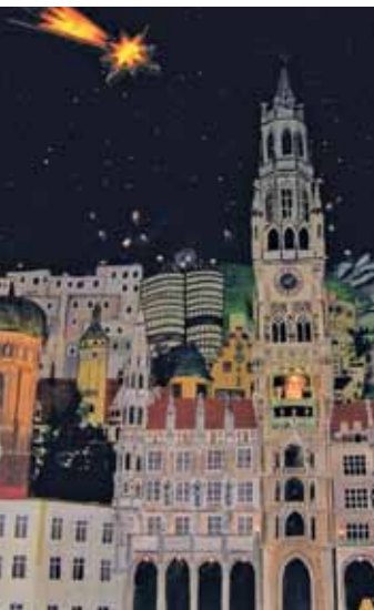
Ausschnitt aus der Renninger Krippe.

Ein etwas ungewöhnliches Thema, das die Verantwortlichen der „Renninger Krippe“ für dieses Jahr gewählt haben. Doch „Ein Kind baut Brücken“ bedeutet: Gerade in unserer Zeit müssen mehr und mehr Brücken gebaut werden, zwischen Religionen, Gruppen und Meinungen. Deshalb ist im Altarraum eine große Brücke aufgebaut. Sie schafft die Verbindung von der orientalischen Welt aus der Zeit Bethlehems hin zur modernen Welt unserer Zeit. An den Seitenwänden der Kirche sind bekannte Brücken aus Europa in Bild und Bauwerk zu sehen, auf der rechten Seite aus Europa, auf der linken Seite aus den anderen Kontinenten. Im Ensemble integriert sind die Krippenfiguren. Sie zeigen auf, wie Brücken Verbindung schaffen zwischen Arm und Reich, Jung und Alt, Christen und Muslimen, Katholiken und Protestanten, Deutschen und Ausländern, Juden und Arabern und innerhalb der Familie.