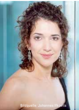
Die Sopranistin Juliane Banse singt am Dreikönigstag beim Stuttgarter Kammerorchester.

Seit mehr als 85 Jahren vermittelt die Kulturgemeinschaft ihren rund 35 000 Mitgliedern Eintrittskarten und Abonnements zu den Kulturveranstaltungen in der Region Stuttgart. 40 verschiedene Abonnementvarianten bietet Deutschlands größte Besucherorganisation in den Sparten Theater, Oper, Ballett, Konzert, Kino, Literatur und Kunst an. Darüber hinaus gibt es zahlreiche Veranstaltungen, die allen Kulturinteressierten auch ohne eine Mitgliedschaft offenstehen.